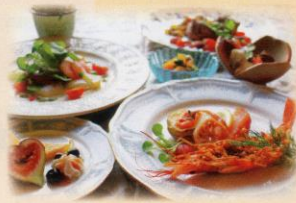
写真は一例です。メニューは毎日変わります。