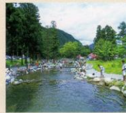
湯沢フィッシングパーク