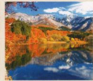
大源太キャニオン