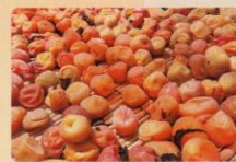
当館屋上に干して作る 無添加の梅干し