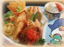
お子さまに大好評！キッズプレート