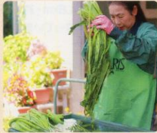
女将の野菜菜漬け、美味しいよ！